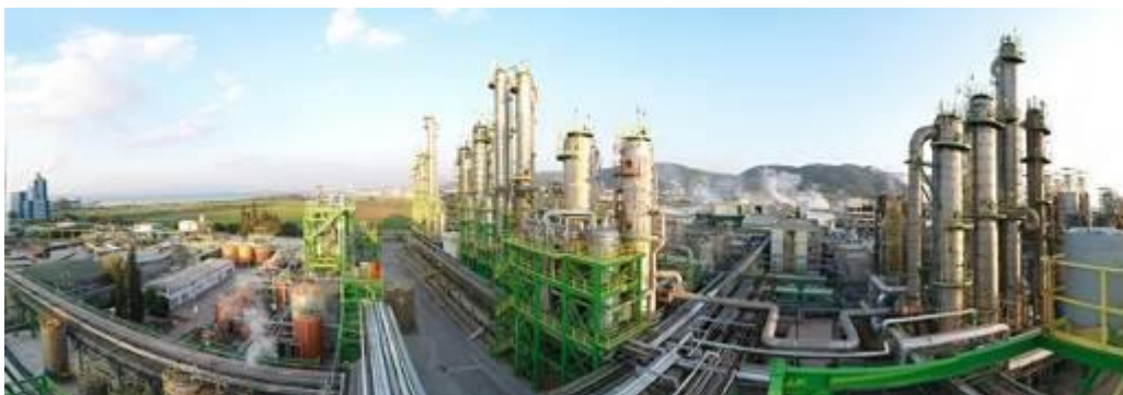
(PM_MDT_AKSA2.jpg und PM_MDT_AKSA3.jpg - © by AKSA) AKSA-Werk in Yalova (Türkei) – eine der größten Produktionsstätten für Acrylfasern.